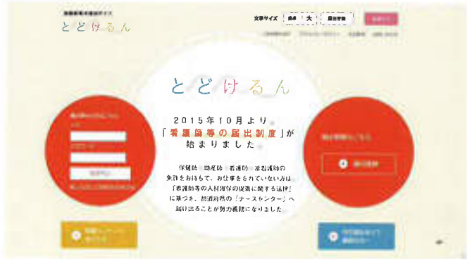
“とどけるん” トップページ